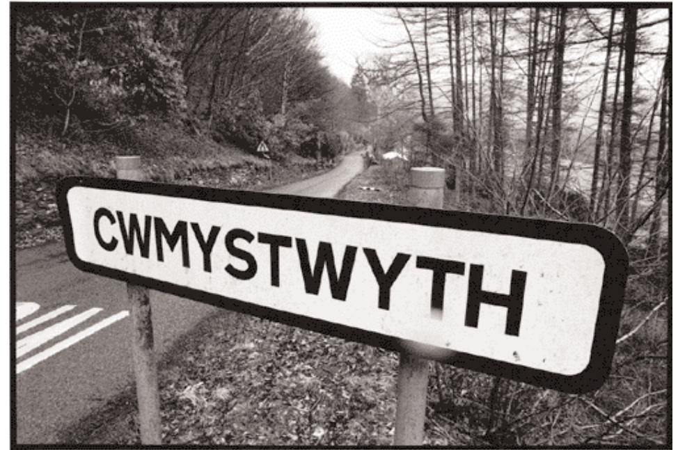
En haut : Pardon ?, Cwmystwyth, Pays de Galles, 4/96. En bas : Au bout de la route, Portnahaven, Islay, Écosse, 10/98.

moi car j'observe leur constante progression. J'apprécie également la duplicité d'une image. En argentique, si votre client ne vous renvoie pas votre ekta original, vous êtes coincé, alors qu'avec un fichier numérique vous disposez d'autant d'originaux que vous le désirez. En revanche, la technologie peut parfois rendre plus compliquée et plus lourde la présentation d'un travail sur ordinateur. Quand on a plusieurs centaines d'images d'un reportage à montrer, c'est parfois plus simple et rapide de les montrer sur une table lumineuse, que de les rechercher et les ouvrir sur son ordinateur. Je constate aussi depuis quelques années, depuis la vraie démocratisation du numérique, que peu de gens connaissent vraiment le sujet. Je regrette par exemple qu'ils ne connaissent en général pas la différence entre une image à 72 dpi et une autre à 300 dpi, une en RVB ou une en CMJN.