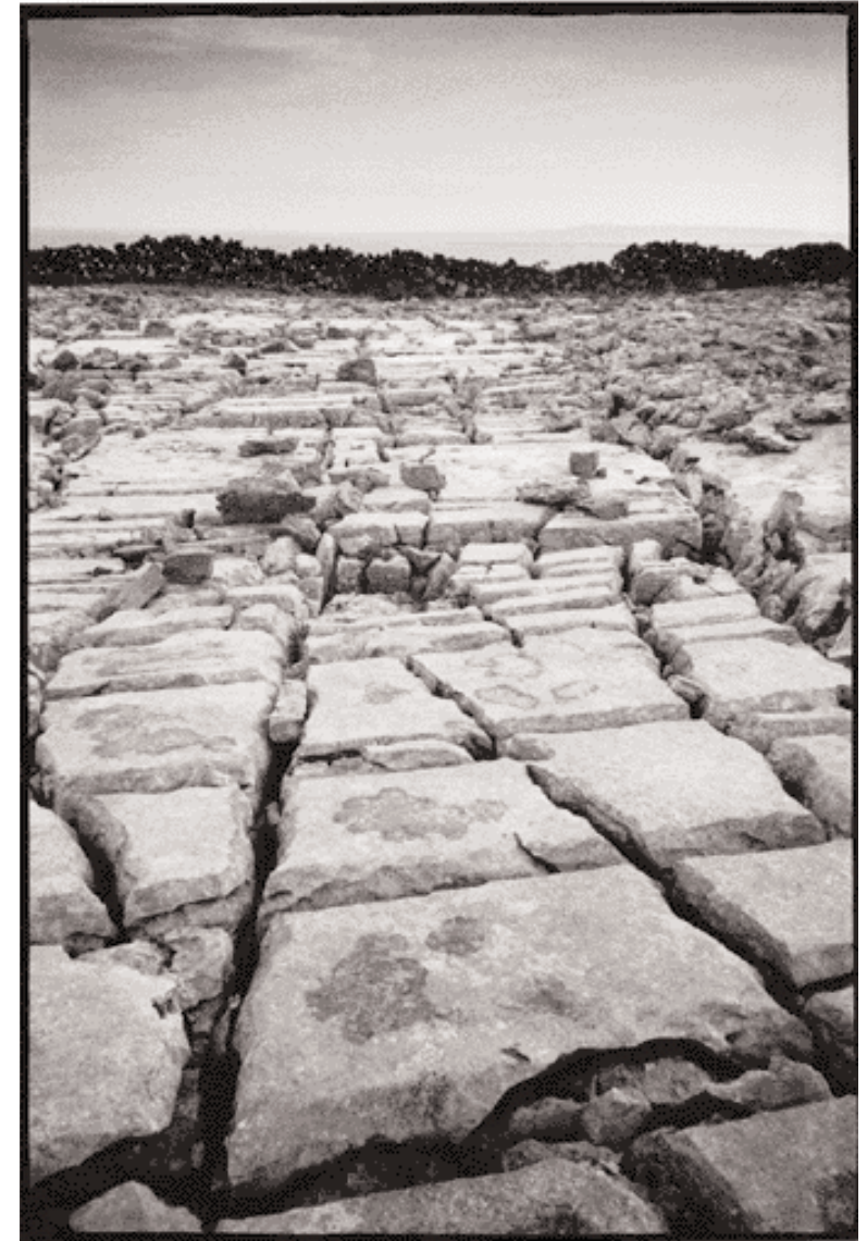
Route ou champ, îles d'Aran, Irlande, 11/94.

DB : Principalement pour répondre à la demande de mes clients : je travaille en freelance pour Reuters depuis huit ans. Le besoin de rapidité est primordial dans la presse, ce n'est souvent pas la meilleure image qui va être choisie par un quotidien mais la première qui arrive sur son réseau. La façon de développer les films sur le terrain à l'époque n'était pas idéale : si vous avez essayé de développer un film C41 dans une buanderie de stade de football et de sécher les films avec un