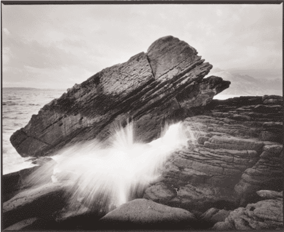
En haut : Passage, Elgol, Skye, Écosse, 11/01. En bas : Vers la mer, Rubha nam Brathairean, Skye, Écosse, 06/03.