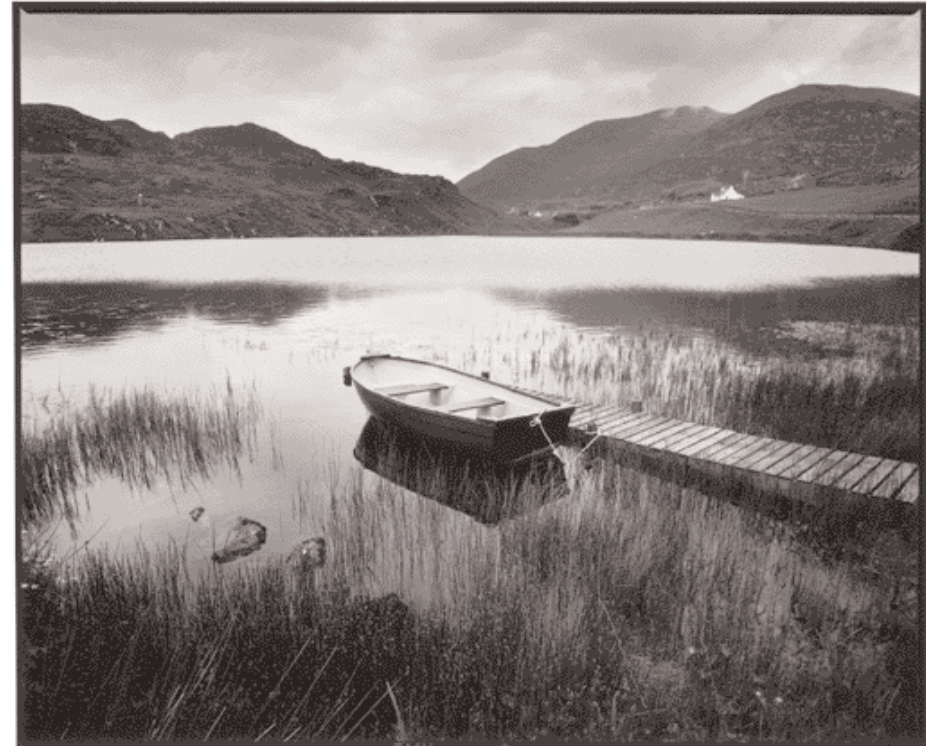
En haut : Au repos, Port Eisgein, Harris, Écosse 06/03. En bas : Mort aux dents, Callanish, Lewis, Écosse, 06/03.

sèche-cheveux, vous savez de quoi je parle ! Ensuite on se prend au jeu : la qualité numérique suffit pour nos besoins, et on en apprécie le confort de travail. En numérique, j'ai travaillé avec toutes les générations de D1 de Nikon et aussi les DCS de Kodak. Mes optiques vont du 14 mm au 400 mm f/2.8, avec une préférence pour le 300 mm. Je suis aussi bien équipé en station de travail numérique. Je suis utilisateur Apple depuis le début, et j'aime la souplesse de leurs machines, leur intuition et leur design. J'ai un Mac G4 de bureau et un portable Titanium pour les reportages. Même si la retouche m'est interdite par contrat avec Reuters, j'utilise Photoshop pour nettoyer mes images des éventuelles poussières, corriger éventuellement le cadrage, le contraste et la balance des couleurs. En revanche, je n'ai pas d'imprimante, je prépare mes fichiers et les donne à un mini-lab qui possède une Fuji Frontier, cette machine m'a donné les meilleurs résultats. Ces tirages sont en principe destinés à mes clients, pour leurs archives, mais je mets de plus en plus les fichiers directement sur CD ou à disposition sur mon site Web.