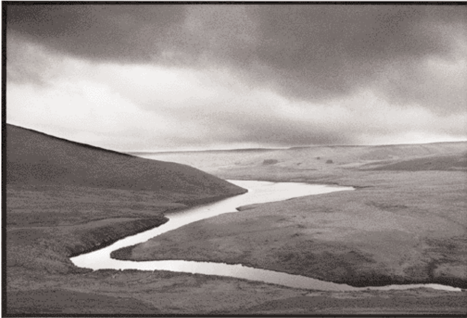
En haut : Zig-zag, Eilan Valley, Pays de Galles, 4/96. En bas : Coule la rivière, Campsie Fells, Écosse, 10/96.